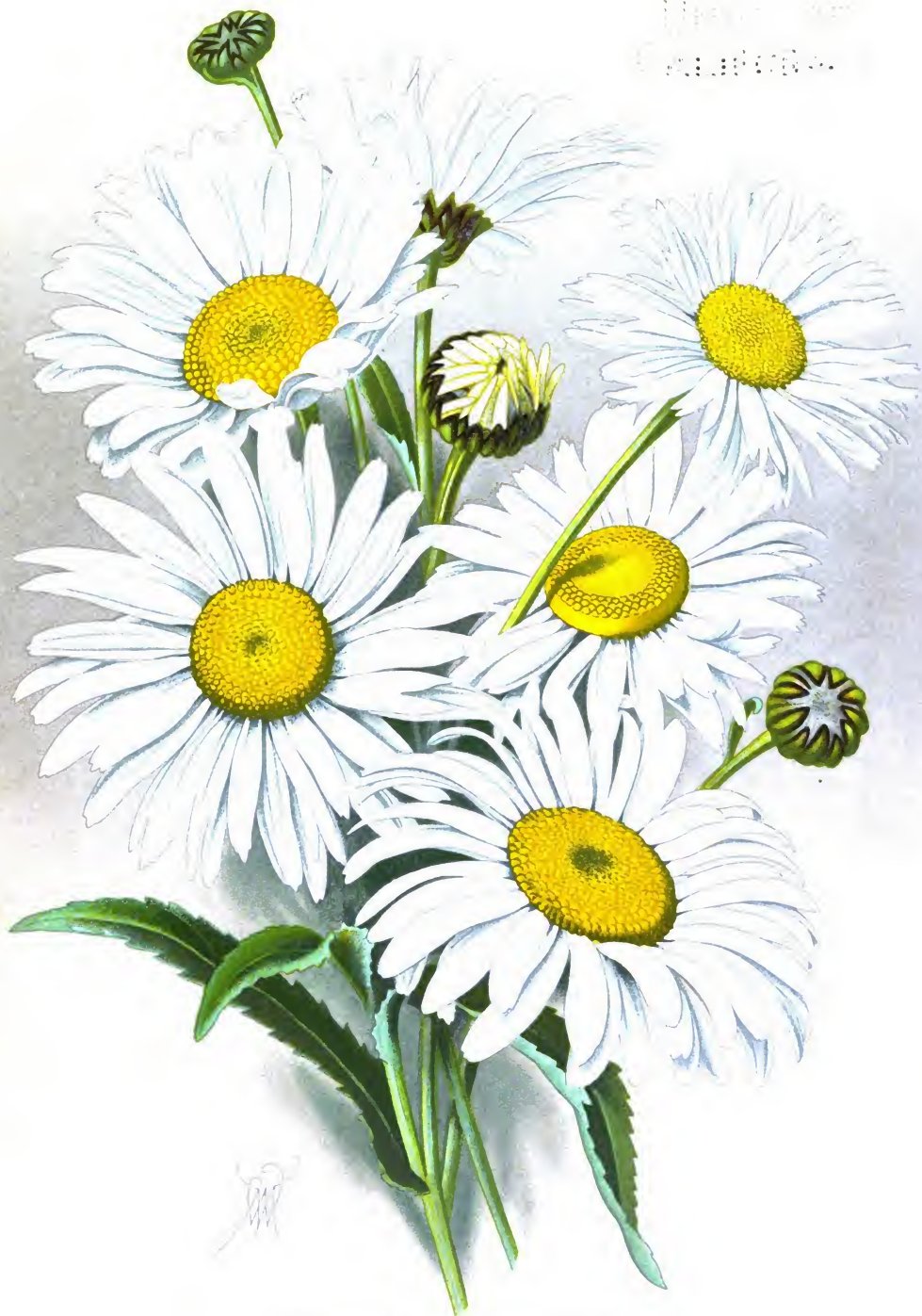
Chrysanthemum maximum var.